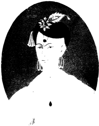
पेशवा माधोराव नारायण